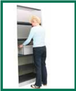
Hauteur de rangement pour les charges lourdes dans une étagère