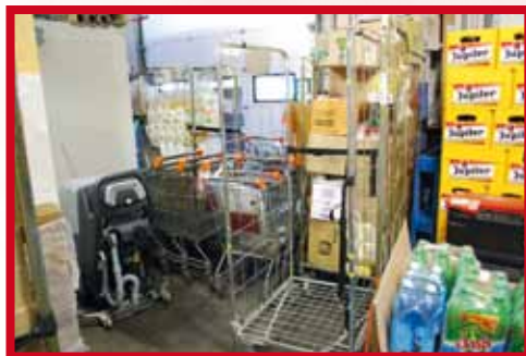
Un atelier en désordre augmente le risque de chute