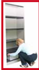
Rangement à hauteur du sol et de la tête à éviter et plutôt destiné à des charges rarement utilisées