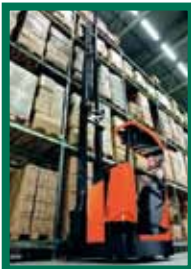
Les préparateurs de commande à cabine inclinable réduisent les contraintes au niveau de la nuque lors des opérations en hauteur