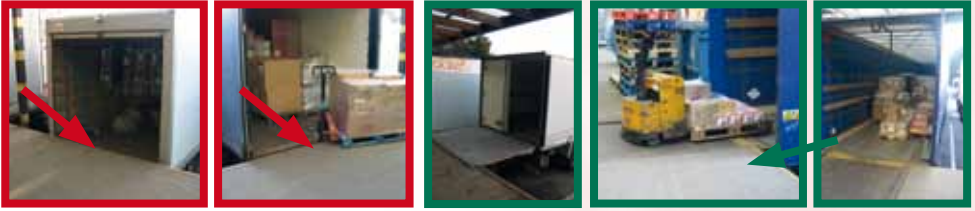
L'utilisation privilégiée de niveleurs de quai hydraulique, de rampe et de hayons facilite l'accès au plancher du camion à partir du quai de chargement