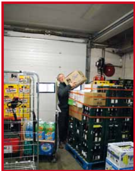
Le manque de place oblige à prendre des postures dangereuses pour le dos