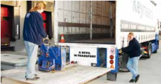
La mise à disposition de rampes rabattables ou escamotables, l'emploi de transpalettes électriques... fournissent une aide appréciable au chargement et déchargement des produits transportés dans le véhicule