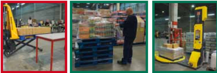
Mise à hauteur de la palette pour en faciliter le filmage manuel, le mieux étant si possible d'utiliser une filmeuse automatique