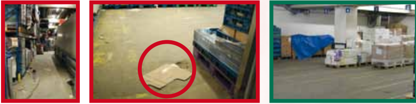
Les voies de circulations doivent être dégagées et exemptes de trous pour éviter les chutes de plain pied