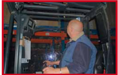
Position inconfortable maintenue dans le temps