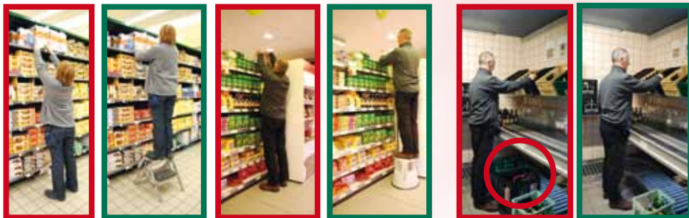
L'utilisation d'un escabeau permet de réduire les contraintes pour atteindre les objets en hauteur