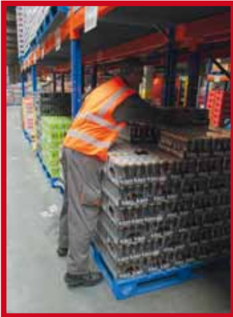
Répétition du geste en position contraignante pour l'épaule et le bras

Voici quelques exemples de situations comportant un risque de type physique chez le réceptionniste de marchandises: