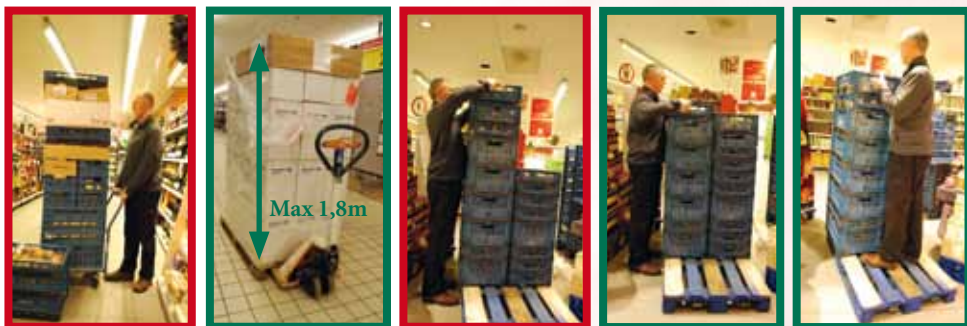
Limiter la hauteur des palettes à une hauteur inférieure à 1m80 (idéal 1,6m)