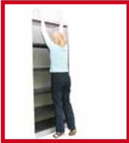
Hauteur supérieure à la tête: pas de charge à cette hauteur!