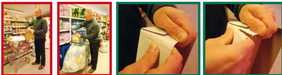
Les prédécoupes dans les cartons et plastiques facilitent leur « cassage »