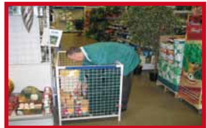
Manutention de charges lourdes répétées