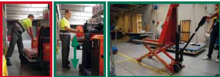
Adaptation mécanique de la hauteur du plan de dépose